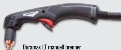
Duramax LT manuell brenner