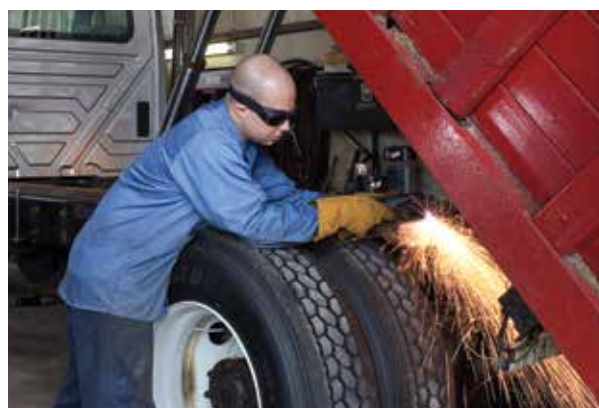
Reparasjon og modifikasjon av biler