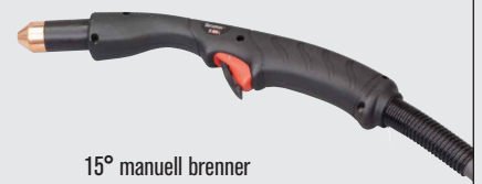
15° manuell brenner