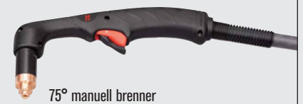
75° manuell brenner

(det finnes flere brennervalg på www.hypertherm.com )