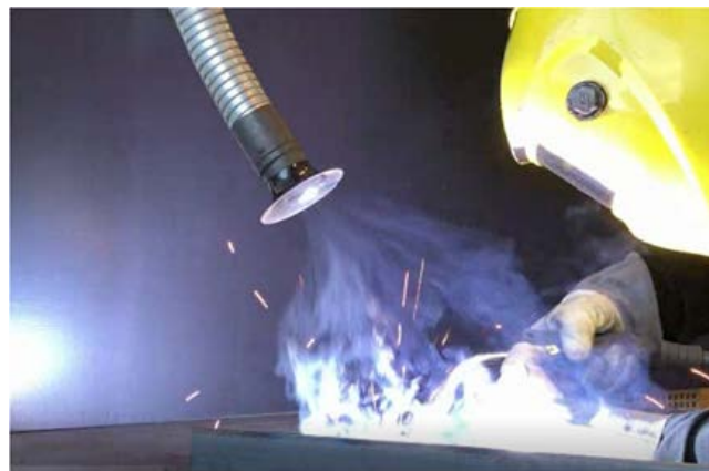
Høyvakuumprossessavg. ▶ EIVA-SAFEX tilbyr en komplett løsning av høyvakuumprossessavg.