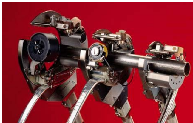
◀ Orbital sveiseutstyr. EIVA-SAFEX har mange års erfaring og leverer hele Arc Machines portefølje.

For mer informasjon se: www.eiva-safex.no