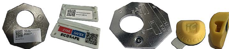
ECOSAFE integrerer RFID/QR-merking og utstyrsportalen Onix til en løsning som gir deg full oversikt over bedriftens utstyr.