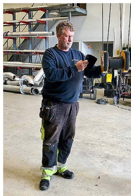
Med ECOSAFE-systemet kan man raskt og enkelt skanne QR-koden og sjekke status på utstyret og hente frem kontrollkort, sertifikater eller brukermanualer ved behov.